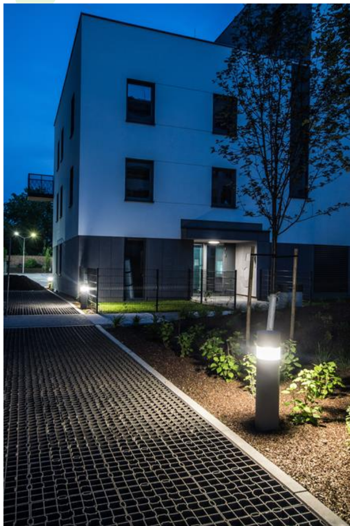
Osiedle na Woli, Warszawa

Oprawa zewnętrzna do montażu na utwardzonym podłożu (beton, kostka brukowa lub fundament) wyposażona w wysokowydajne, energooszczędne źródła LED najnowszej generacji. Obudowa odporna na korozję, wykonana z aluminium. Produkt przeznaczony do efektywnego oświetlenia ścieżek spacerowych, parków, terenów rekreacyjnych, obszarów mieszkalnych. Stopień ochrony przed wnikaniem ciał stałych, pyłu i wilgoci: IP65.